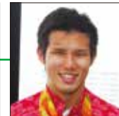
東京ガス (パラ水泳) 木村 敬一 選手